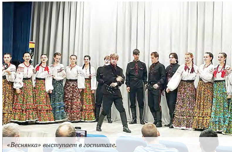
«Веснянка» выступает в госпитале.