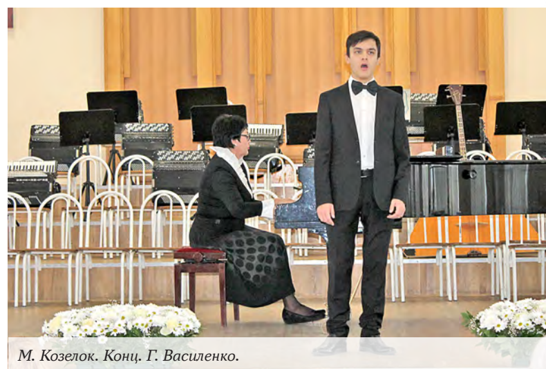
М. Козелок. Конц. Г. Василенко.